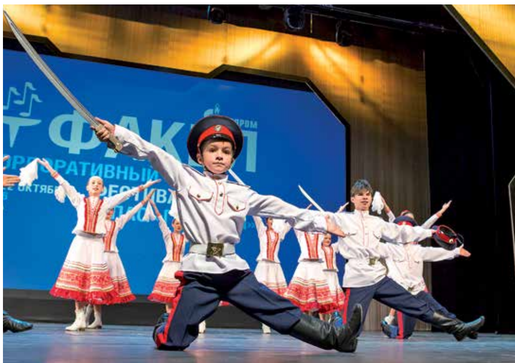
«Донской родничок» (ООО «Газпром трансгаз Волгоград»)