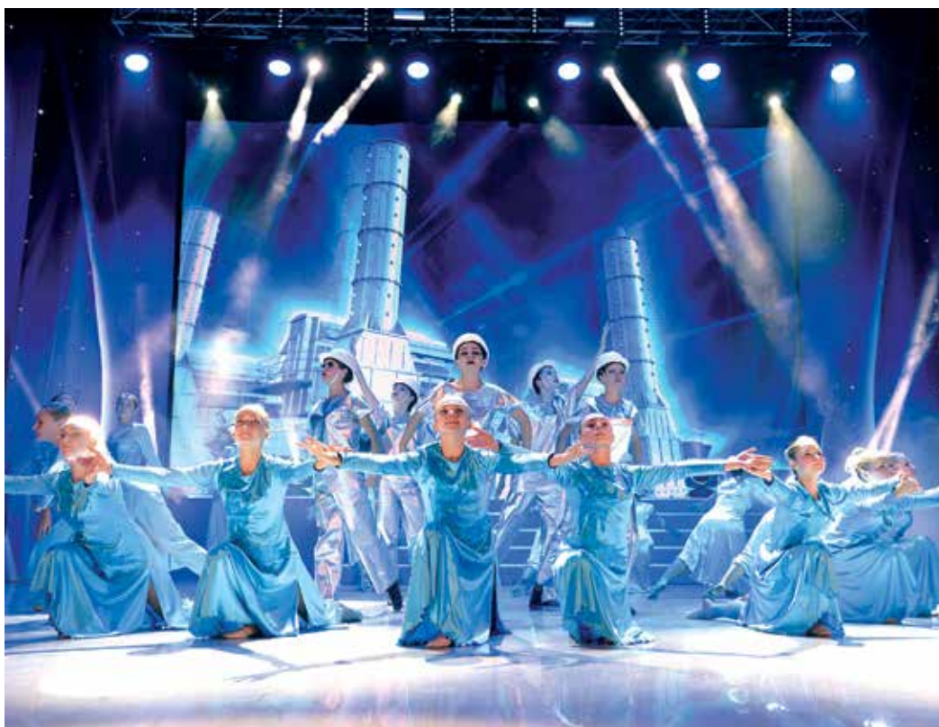
«Незабудка» – сплоченный коллектив

Ежедневные четырехчасовые тренировки и репетиции на сцене, многочисленные выступления на корпоративных и региональных площадках – в таком авральном режиме готовились к «Факелу» участницы хореографического ансамбля «Незабудка» из ООО «Газпром трансгаз Ставрополь».