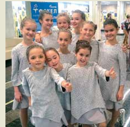
Участники детского вокального ансамбля «Барби коктейль» (ООО «Газпром трансгаз Казань»)

«Мы ходили уже на две экскурсии – по городу и в музей. В музее было очень интересно, нас угостили вкусным медом, но больше всего понравился вид с высоты у памятника Салавату Юлаеву. Очень хочется подольше погулять и посмотреть, что еще есть в Уфе, именно этим мы и займемся в следующие дни!»