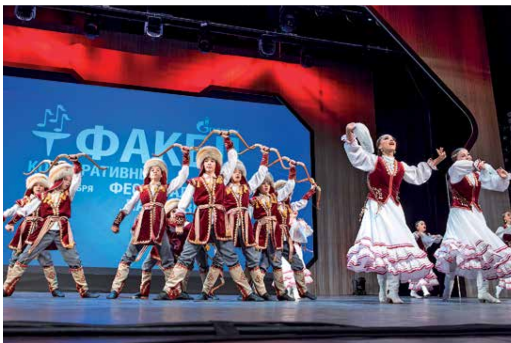
«Далан» (ООО «Газпром трансгаз Уфа»)